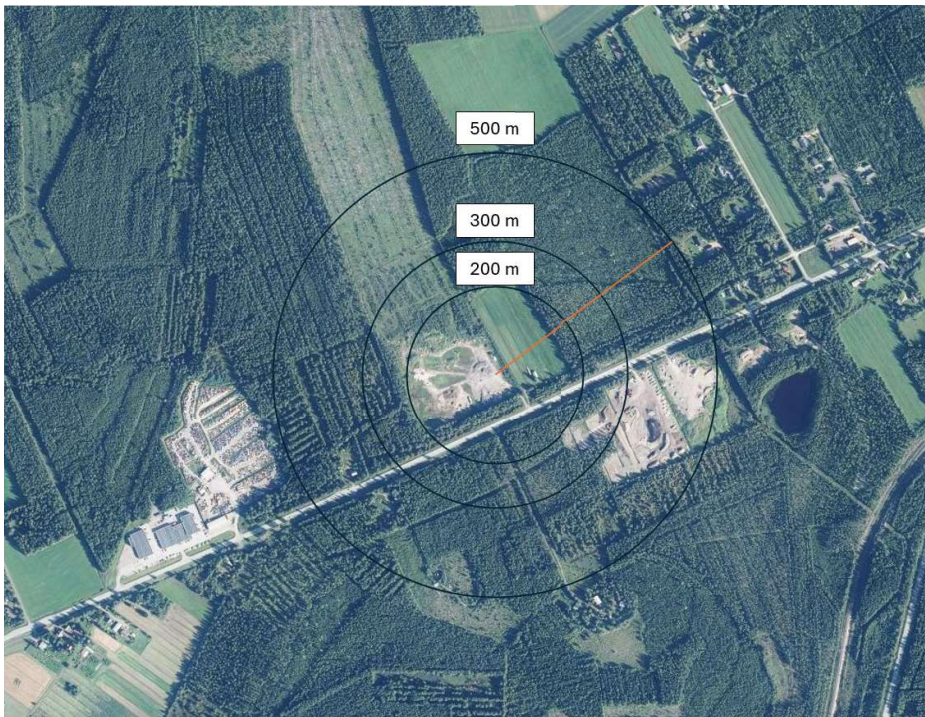
Kuva 2. Todellisuudessa haketuspaikan ja Päräsänsuon välisellä alueella on metsikköä, joka vaimentaa melua.